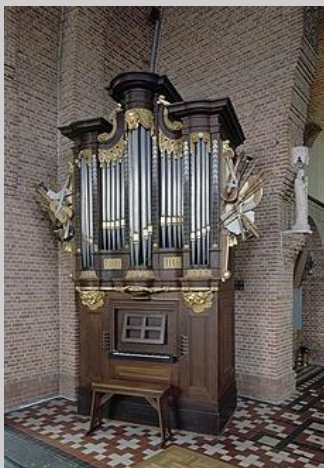
3 Het Rogier-orgel te Koewacht

http://www.orgelsinzeeland.nl/navigatie_plaats_koewacht_kerkvandehhphillipusenjacobus.htm