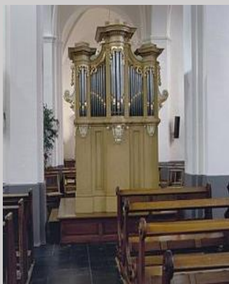
2 Het Onderhorst/Rogier-orgel te Clinge