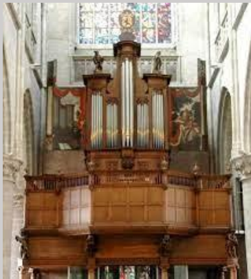
1 Het Isoré/Delhaye/Flentrop-orgel te Hulst